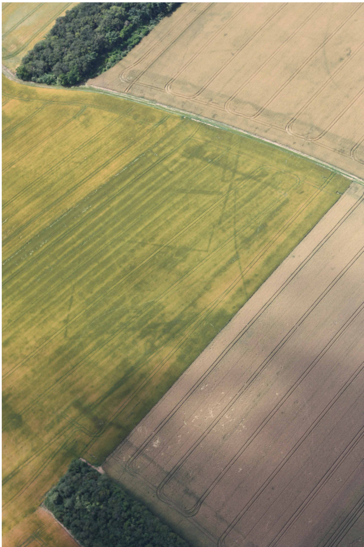
Fig. 1 : photographie aérienne de l'établissement.