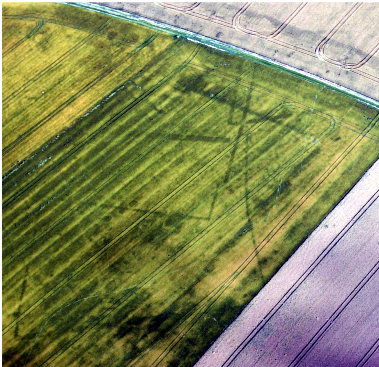
Fig. 2 : photographie aérienne de l'établissement en couleur modifiée (© Société archéologique de la région de Puisseaux, cliché Dominique Godefroy 2012).