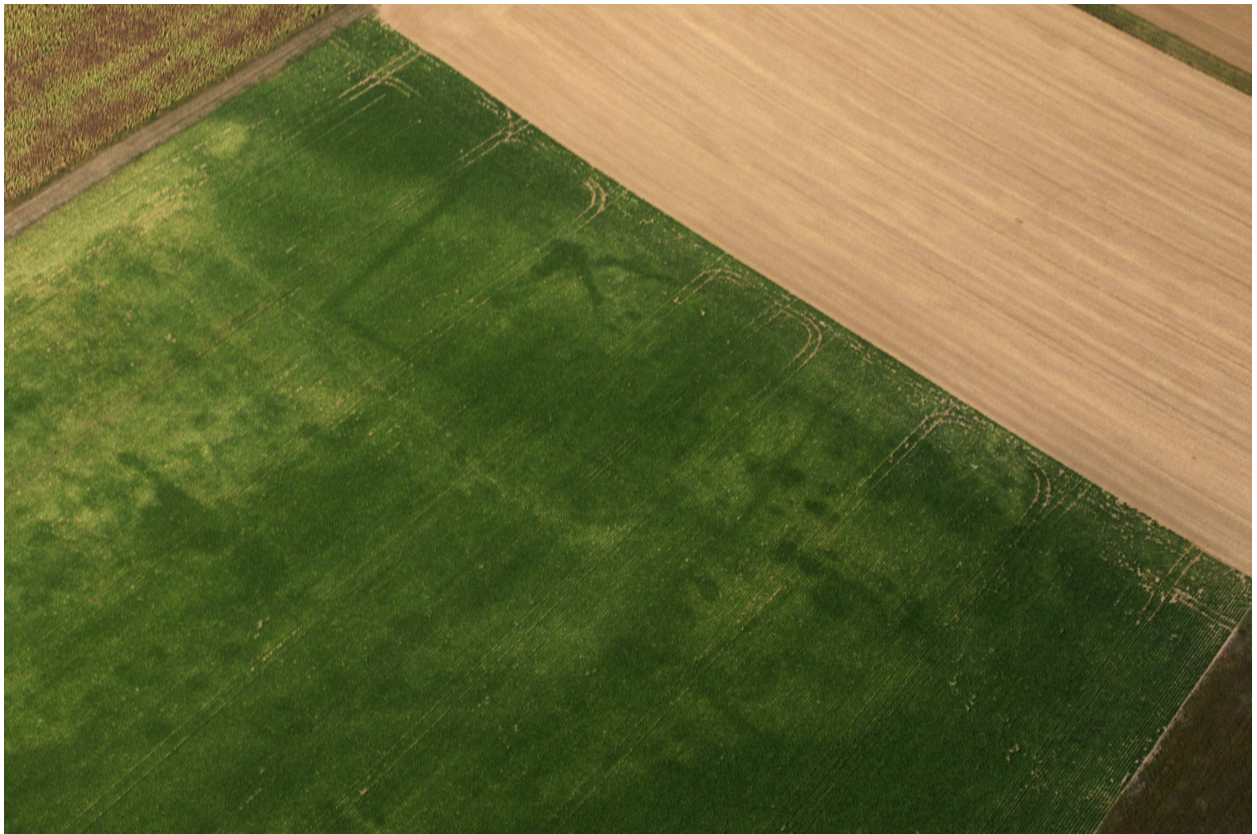
Fig. 2 : photographie aérienne de l'établissement (partie sud).