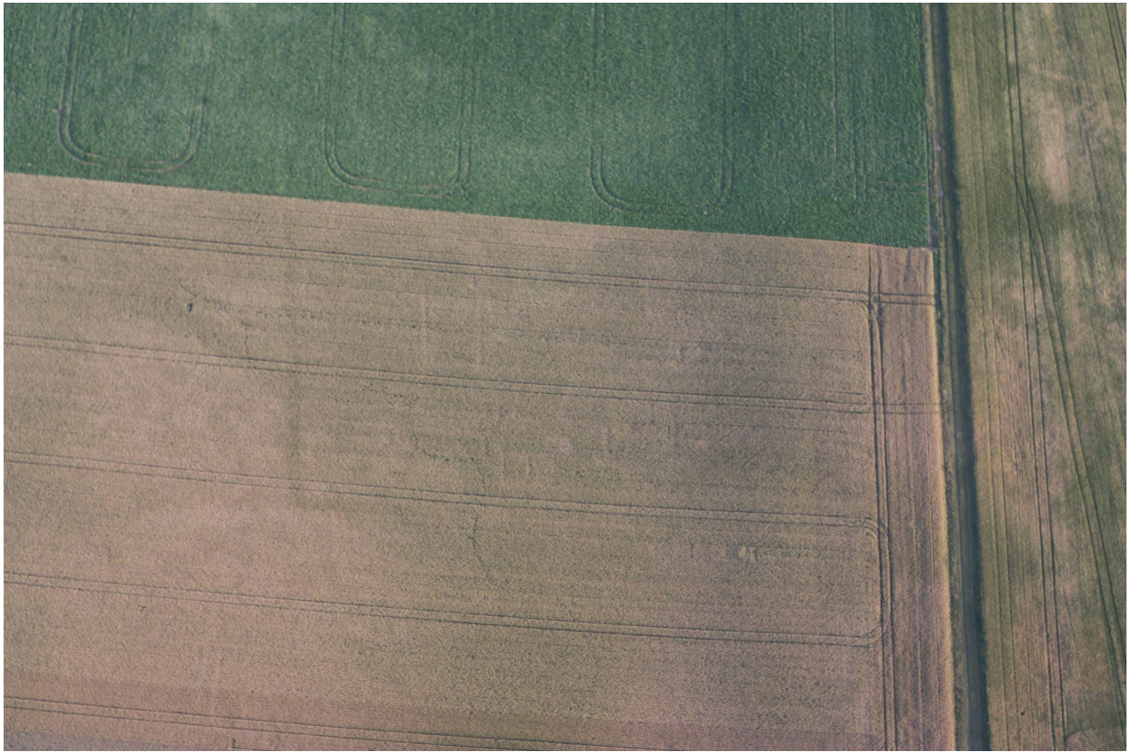
Fig. 1 : photographie aérienne de l'établissement (partie nord) (© Société archéologique de la région de Puisieux, cliché Dominique Godefroy 2010c).